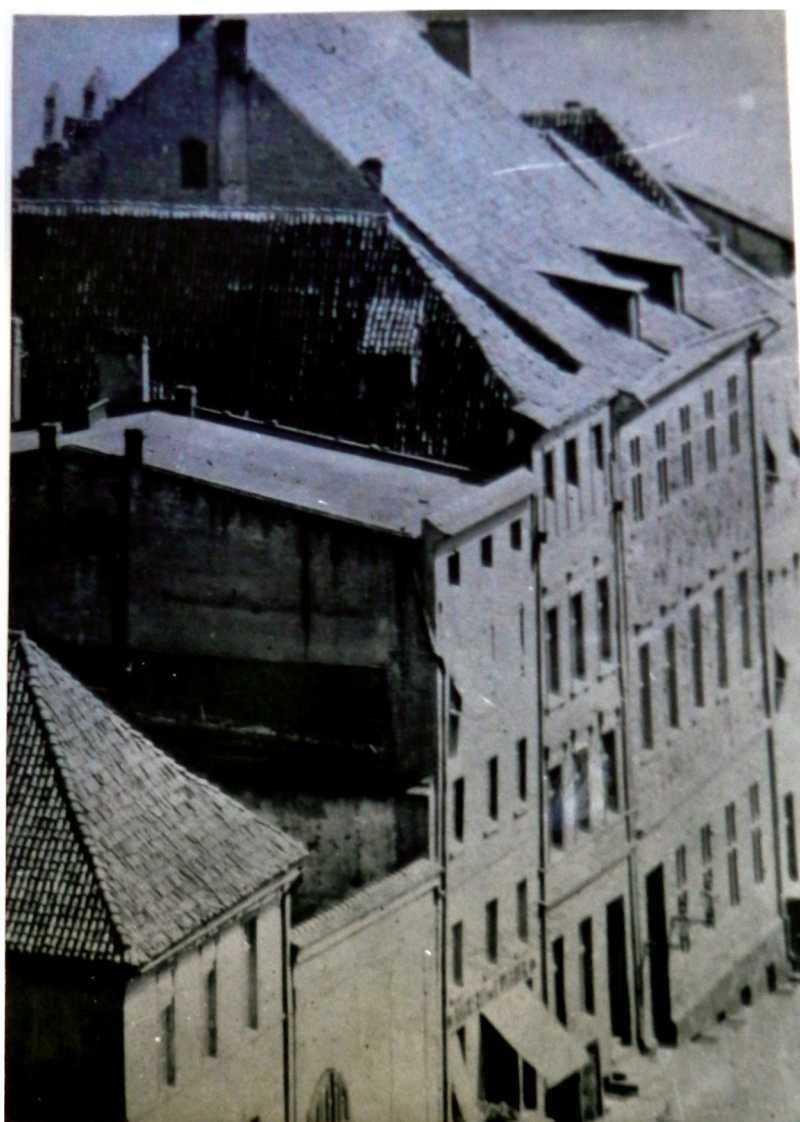
5. Fotografia Torunia z 2 poł. XIX w., z widocznym dawnym Pałacem Biskupim krytym dwuspadowym dachem. Reprod. J. Wardak w dokumentacji: A. Warszycki, Pałac Biskupi przy ul. Żeglarskiej 8. Dokumentacja historyczno-architektoniczna, Toruń 1970 r., archiwum WKZ Toruń, sygn.: 1123.