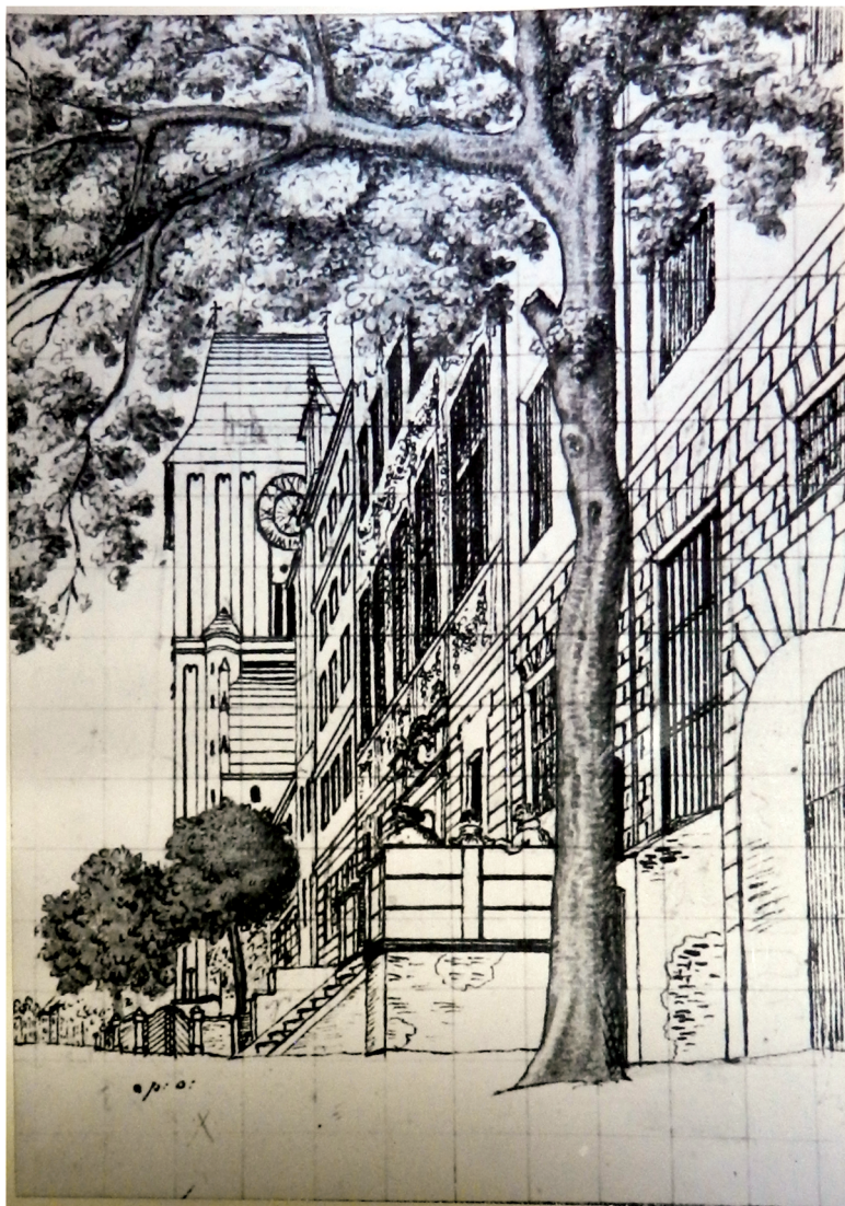
3. Rysunek ul. Żeglarskiej autorstwa Koeniga z 1822 r. z widoczną elewacją Pałacu Biskupiego (Muzeum Okręgowe w Toruniu). Reprodukcja J. Wardaka w dokumentacji: A. Warszucki, Pałac Biskupi przy ul. Żeglarskiej 8. Dokumentacja historyczno-architektoniczna, Toruń 1970 r., archiwum WKZ Toruń, sygn.: 1123.