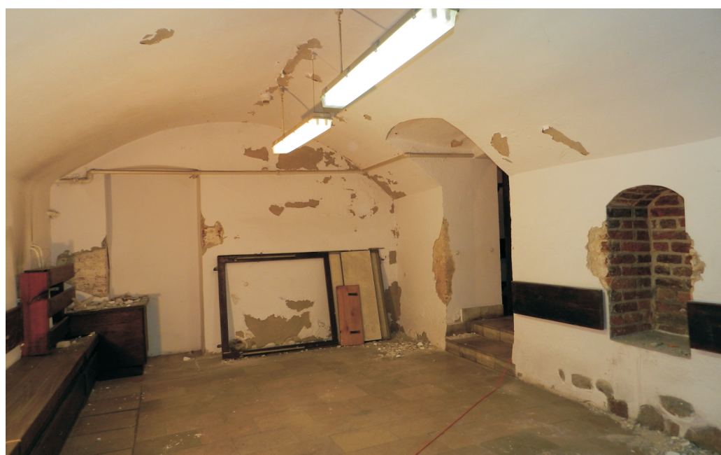
48. Piwnica. Pomieszczenie pd.-wsch. traktu tylnego (0.15). Widok od strony tylnej na mur międzytraktowy. Fot. E. Nawrocka, 2013 r..