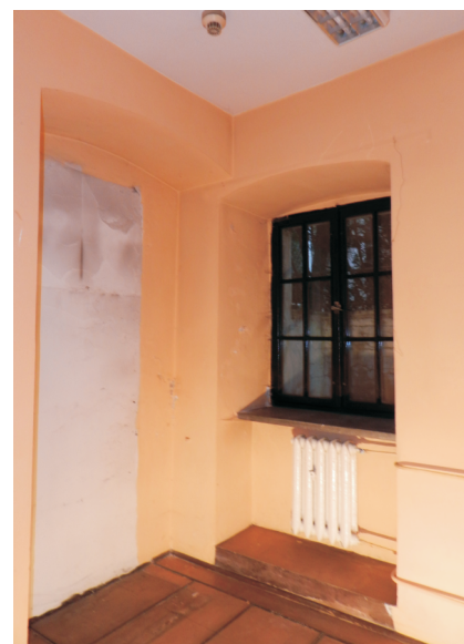
54. Piwnica oficyny. Pomieszczenie w części zach.. Widok w kierunku pn.-zach.. Fot. E. Nawrocka, 2013 r..