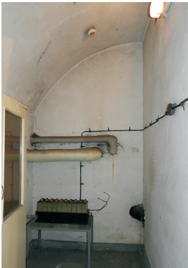
50. Piwnica. Pomieszczenie 0.16. Widok od strony wejścia na mur tylny. Fot. E. Nawrocka, 2013 r..