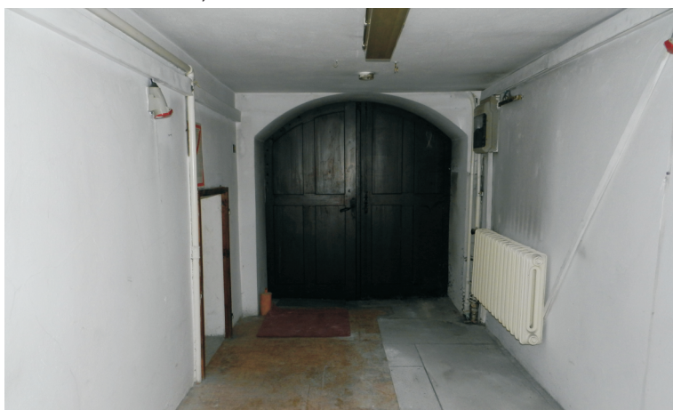
53. Piwnica oficyny. Pomieszczenie w części wsch. z widokiem na bramę wychodzącą na podwórze.