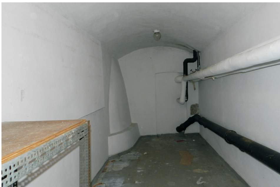
47. Piwnica. Pomieszczenie pn.-wsch. traktu tylnego (0.10). Widok od strony tylnej na mur międzytraktowy. W głębi z lewej obudowa studni. Fot. E. Nawrocka, 2013 r..