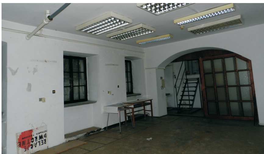
52. Piwnica oficyny w części wsch.. Widok w kierunku pn.-wsch.. Fot. E. Nawrocka, 2013 r..