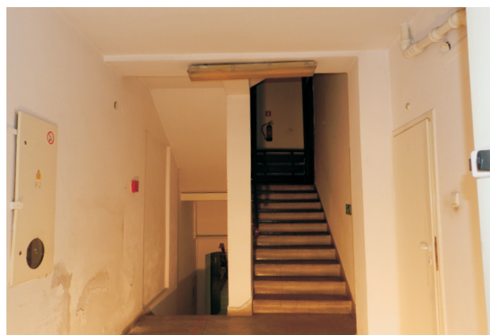
51. Piwnica oficyny w części zach.. Widok od strony wsch. na schody. Fot. E. Nawrocka, 2013 r..