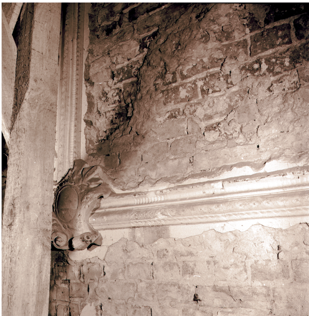
47. Fragment ściany z detalem na 1 piętrze w sali traktu frontowego. Stan w trakcie remontu w r. 1987. Fot. PP PKZ o. Toruń, negatyw w zbiorach AP w Toruniu, Pl. Rapackiego 4, fot. i neg. PP PKZ o. Toruń, sygn. 9641/25.