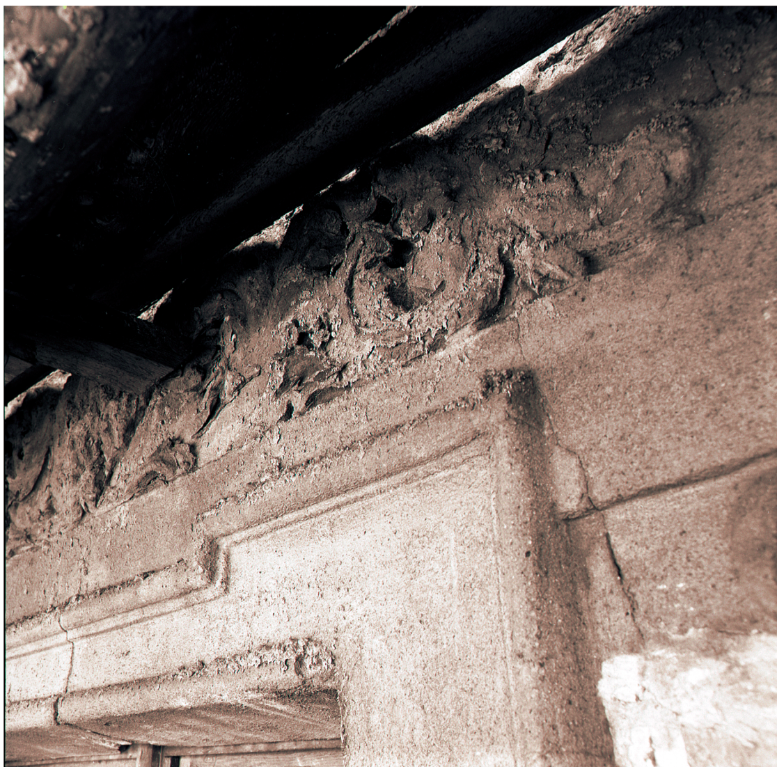
40. Fragment detalu z opaską okna elewacji frontowej w trakcie remontu w l. 80 XX w.. sygn. 9225/7.