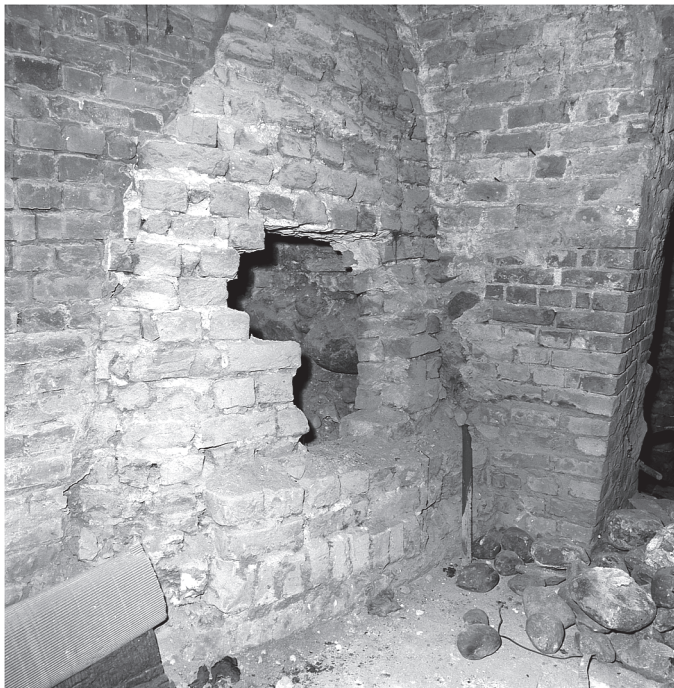
42. Piwnica, pom. 0.10. Narożnik pd.-zach.. Domniemana studnia. Fot. ok. 1975 r.. Fot. PP PKZ o. Toruń, negatyw w zbiorach AP w Toruniu, Pl. Rapackiego 4, fot. i neg. PP PKZ o. Toruń, sygn. 9677/6.