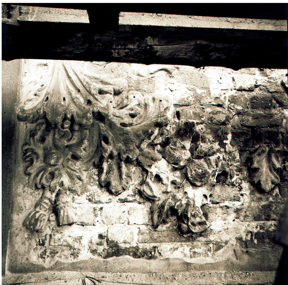
41. Fragment detalu pod oknem 1 piętra elewacji frontowej w trakcie remontu w l. 80 XX w.. Fot. PP PKZ o. Toruń, negatyw w zbiorach AP w Toruniu, Pl. Rapackiego 4, fot. i neg. PP PKZ o. Toruń, sygn. 9760/2.