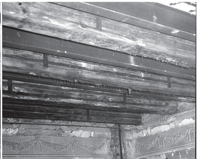
45. 1 piętro, sala traktu tylnego. Fragment stropu belkowego w trakcie remontu w r. 1983. Fot. PP PKZ o. Toruń, negatyw w zbiorach AP w Toruniu, Pl. Rapackiego 4, fot. i neg. PP PKZ o. Toruń, sygn. 9527/5.