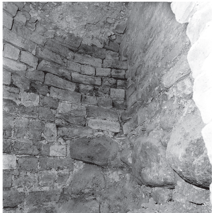
43. Piwnica, pom. 0.10. Narożnik pd.-zach.. Wnętrze domniemanej studni. Fot. ok. 1975 r.. Fot. PP PKZ o. Toruń, negatyw w zbiorach AP w Toruniu, Pl. Rapackiego 4, fot. i neg. PP PKZ o. Toruń, sygn. 9677/5.