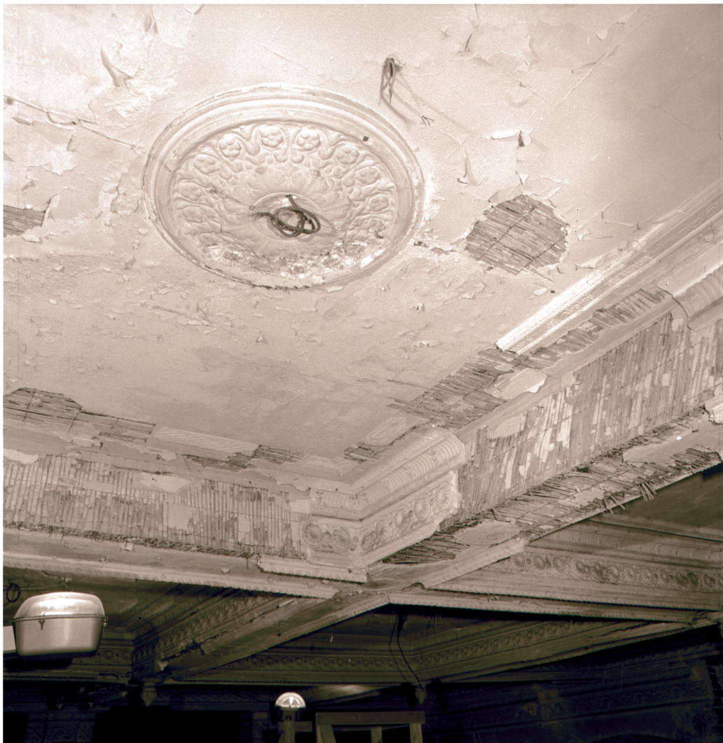
46. Fragment stropu na 1 piętrze w sali traktu frontowego. Stan przed remontem w r. 1987.