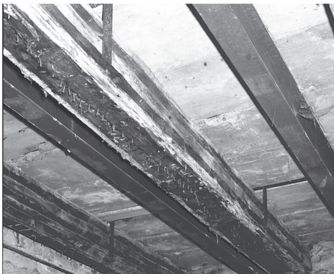
44. 1 piętro, sala traktu tylnego. Fragment stropu belkowego w trakcie remontu w r. 1983. sygn. 9527/4.