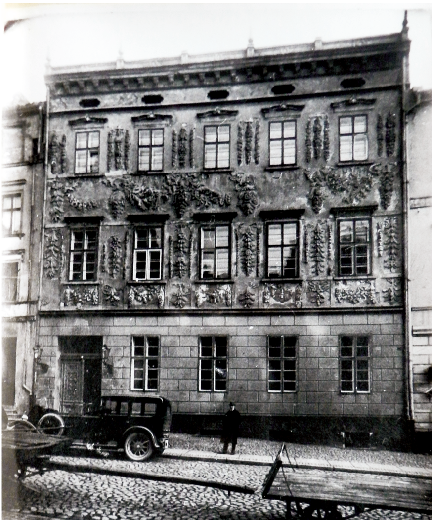
17. Elewacja frontowa Pałacu na fotografii z 1920 r. (w zbiorach Biblioteki Głównej UMK w Toruniu, Gabinet Sztuki). Widoczne duże ubytki sztukaterii. Reprod. M. Sowińskiej w dokumentacji: Album ikonografii miasta Torunia, T. XVI, Pałace, Wnętrza kamienic, Bramy, Portale, Witryny, dokumentacja pod red. Z. Balewskiego - PP PKZ Toruń PDNH, Toruń 1981 r., Archiwum MKZ Toruń, sygn. 550/16.