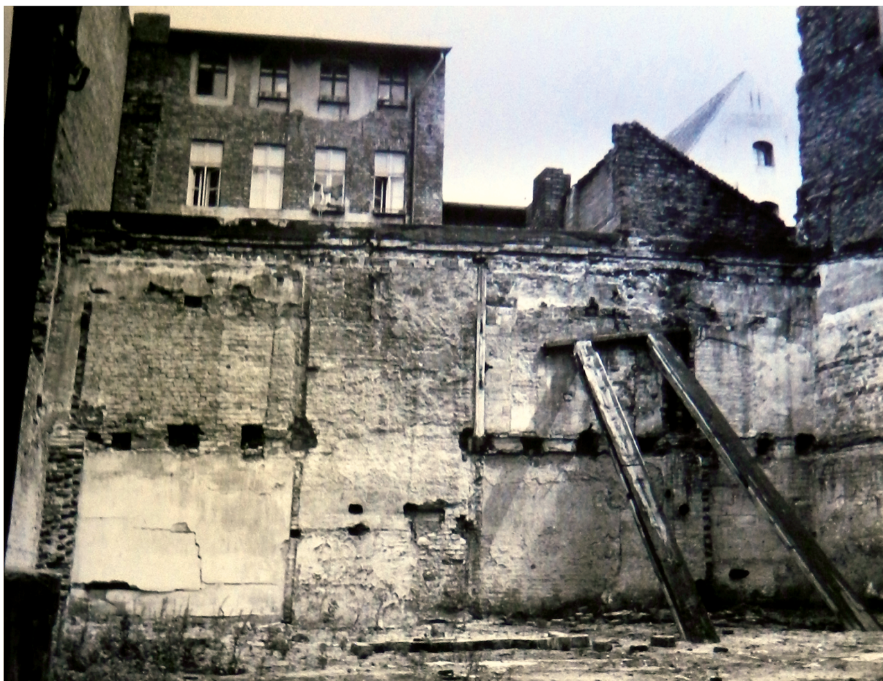
28. Tylne - wsch. część parceli ze śladem po rozebranej oficynie tylnej. Fot. J. Wardak 1970 r., w dokumentacji: A. Warszycki, Pałac Biskupi przy ul. Żeglarskiej 8. Dokumentacja historyczno-architektoniczna, Toruń 1970 r., archiwum WKZ Toruń, sygn.: 1123.