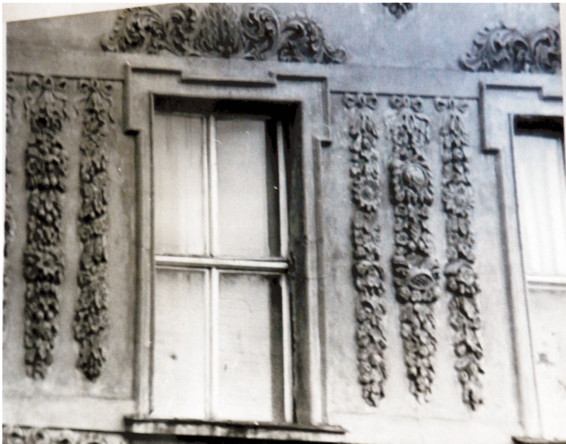
25. Detal przy oknach na 2 piętrze elewacji frontowej. Stan w 1970 r.. Fot. j.w..