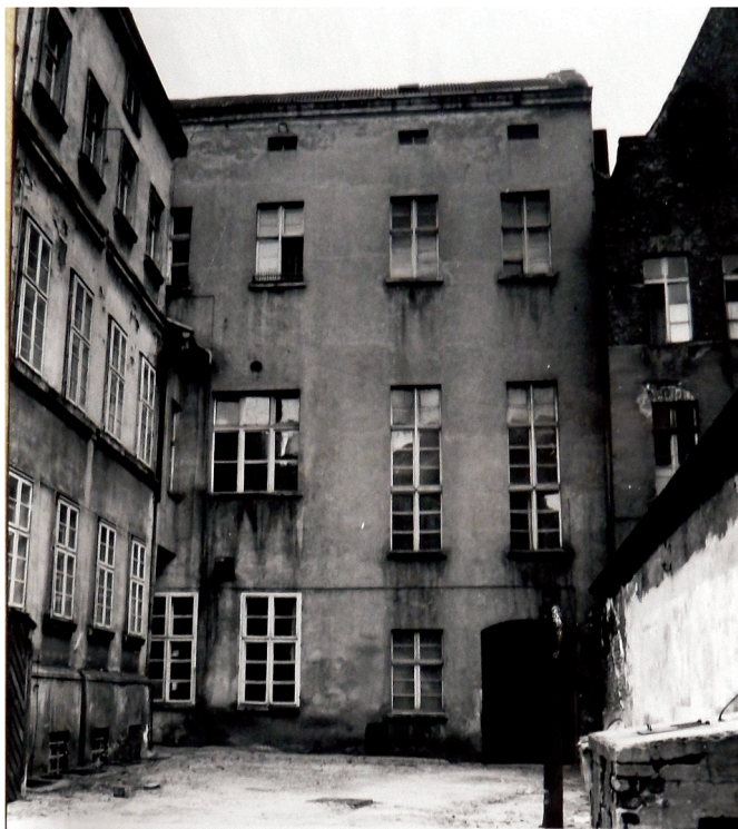
26. Elewacje podwórzowe budynku frontowego i oficyny, fot. J. Wardak 1970 r., w dokumentacji: A. Warszycki, Pałac Biskupi przy ul. Żeglarskiej 8. Dokumentacja historyczno-architektoniczna, Toruń 1970 r., archiwum WKZ Toruń, sygn.: 1123.