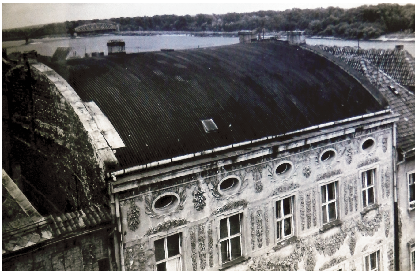
19. Widok na poprzedni dach budynku w 1970 r.. Fot. J. Wardak 1970 r., w dokumentacji: A. Warszycki, Pałac Biskupi przy ul. Żeglarskiej 8. Dokumentacja historyczno-architektoniczna, Toruń 1970 r., archiwum WKZ Toruń, sygn.: 1123.