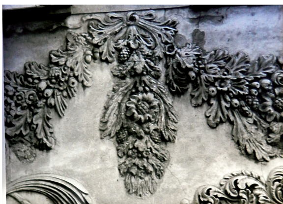
22. Fragment detalu elewacji frontowej nad 1 piętrem. Stan w 1970 r..