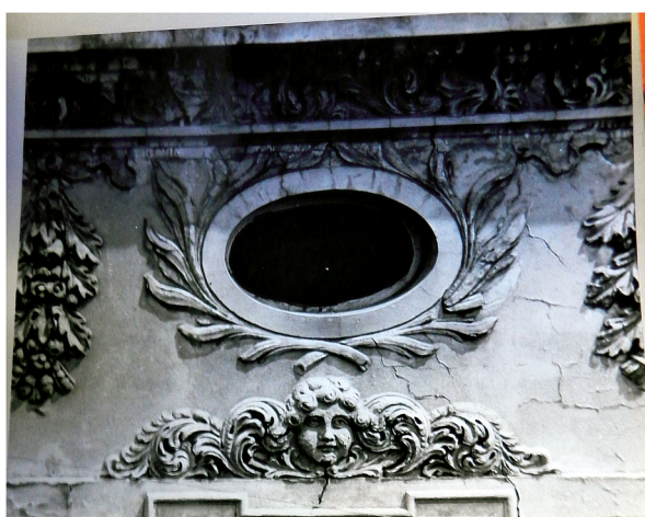
20. Fragment detalu elewacji frontowej w strefie poddasza. Stan w 1970 r.. Fot. J. Wardak 1970 r., w dokumentacji: A. Warszycki, Pałac Biskupi przy ul. Żeglarskiej 8. Dokumentacja historyczno-architektoniczna, Toruń 1970 r., archiwum WKZ Toruń, sygn.: 1123.