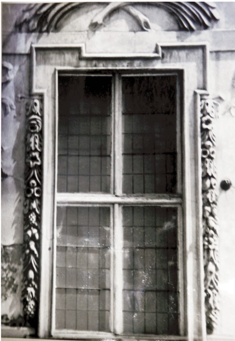
24. Okno na 1 piętrze elewacji frontowej. Stan w 1970 r.. Fot. j.w..