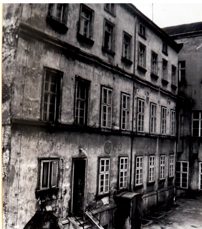
27. Elewacja oficyny, fot. J. Wardak 1970 r., w dokumentacji: A. Warszycki, Pałac Biskupi przy ul. Żeglarskiej 8. Dokumentacja historyczno-architektoniczna, Toruń 1970 r., archiwum WKZ Toruń, sygn.: 1123.