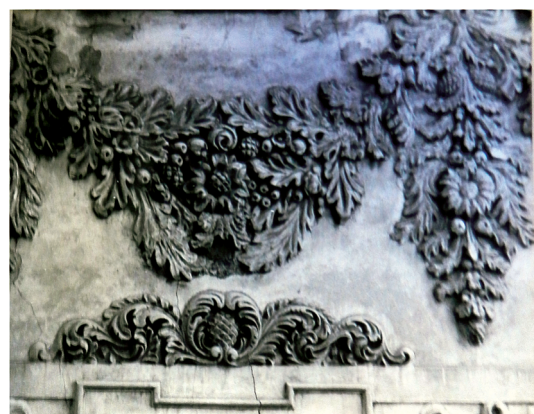
23. Fragment detalu elewacji frontowej nad 1 piętrem. Stan w 1970 r..