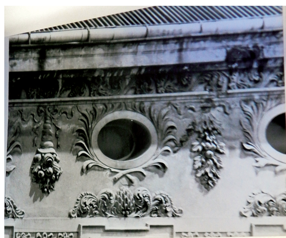
21. Fragment detalu elewacji frontowej w strefie poddasza. Stan w 1970 r.. Fot. J. Wardak 1970 r., w dokumentacji: A. Warszycki, Pałac Biskupi przy ul. Żeglarskiej 8. Dokumentacja historyczno-architektoniczna, Toruń 1970 r., archiwum WKZ Toruń, sygn.: 1123.