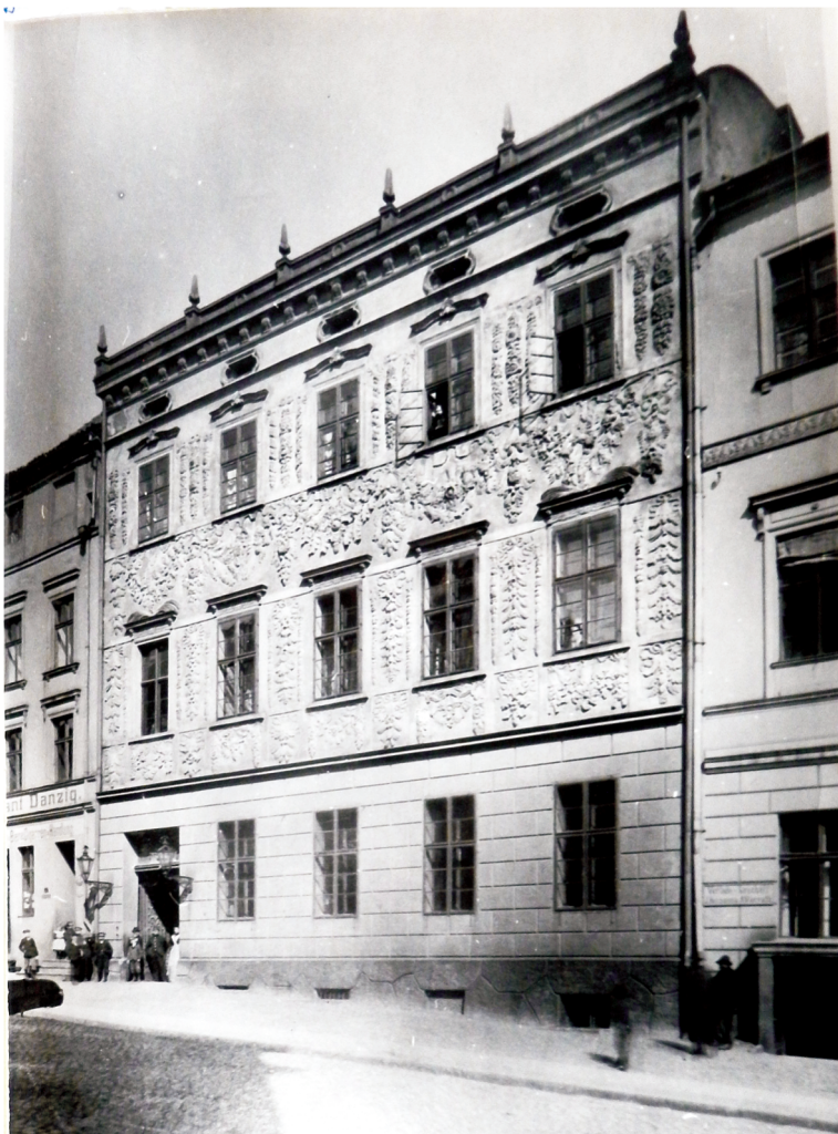
16. Elewacja frontowa Pałacu na fotografii H. Gordona z 1902 r. (w zbiorach Książnicy Kopernikańskiej w Toruniu, Dział Zbiorów Specjalnych, Grafika, T.4, nr 45). Reprod. M. Sowińskiej w dokumentacji: Album ikonografii miasta Torunia, T. XVI, Pałace, Wnętrza kamienic, Bramy, Portale, Witryny, dokumentacja pod red. Z. Balewskiego - PP PKZ Toruń PDNH, Toruń 1981 r., Archiwum MKZ Toruń, sygn. 550/16.